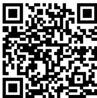
Google Play 下载二维码